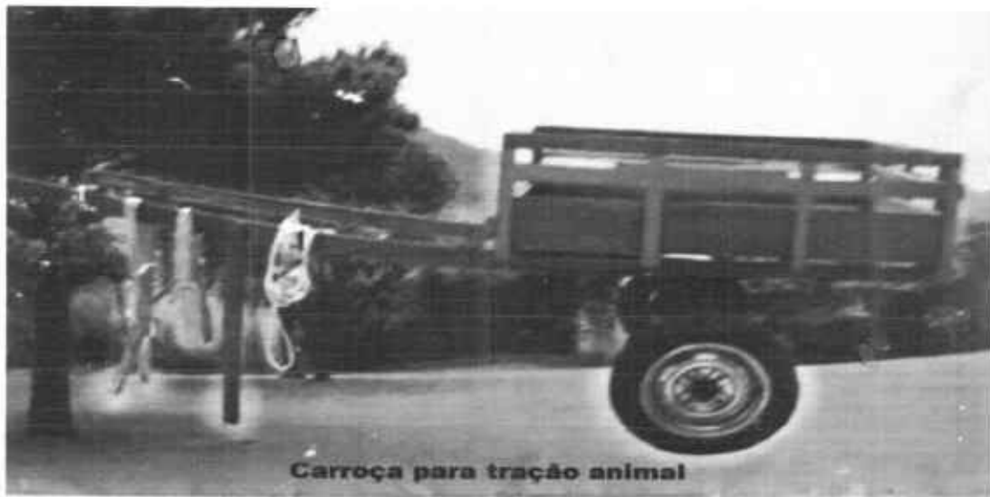
Carroça para tração animal

No início trabalhava apenas consertando pequenas ferramentas usadas na agricultura, tais como: chibancas, alavancas, ferrão, esporas, picaretas e outros. Em 1956, adquiriu um prédio na rua Expedicionário Moreno, nº 135, no Centro da cidade, onde começou a fabricar diversos implementos agrícolas como: arados, cultivadores e carroças de tração animal, este último sendo o principal implemento fabricado na Oficina São Raimundo. Devido à qualidade exigida pelo seu idealizador, tanto pelo rigor das escolhas dos